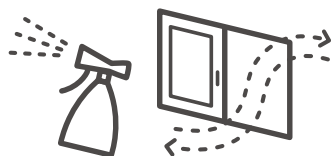
施設の換気・消毒

発熱症状等の相談は、まずかかりつけ医へ電話 かかりつけ医を持たない方や土日や夜間など相談先に迷った場合は、「受診・相談センター」へ