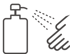
手指の消毒設備の設置